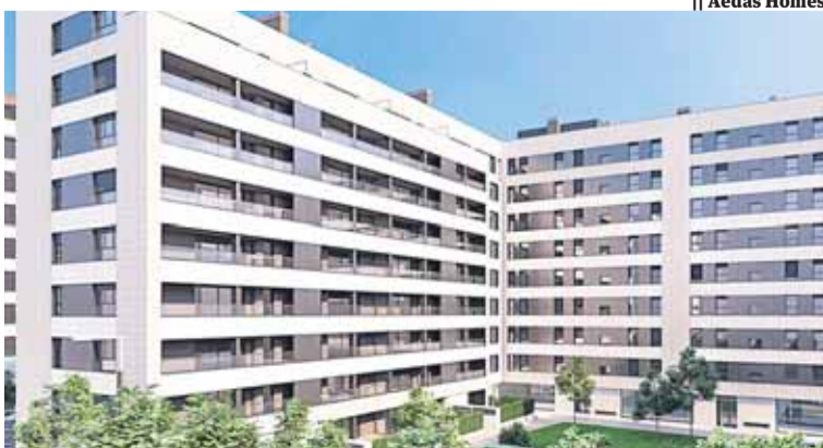
|| Aedas Homes

Norte, que ha quintuplicado sus entregas, representando casi el 70% de las mismas y el 14% de las 3.544 viviendas de la promotora de nivel nacional. Unos datos que han contribuido a que Aedas registre los mejores resultados anuales de su historia. [P 24]