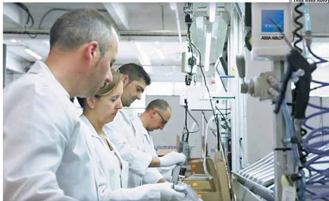
|| Tesa Assa Abloy